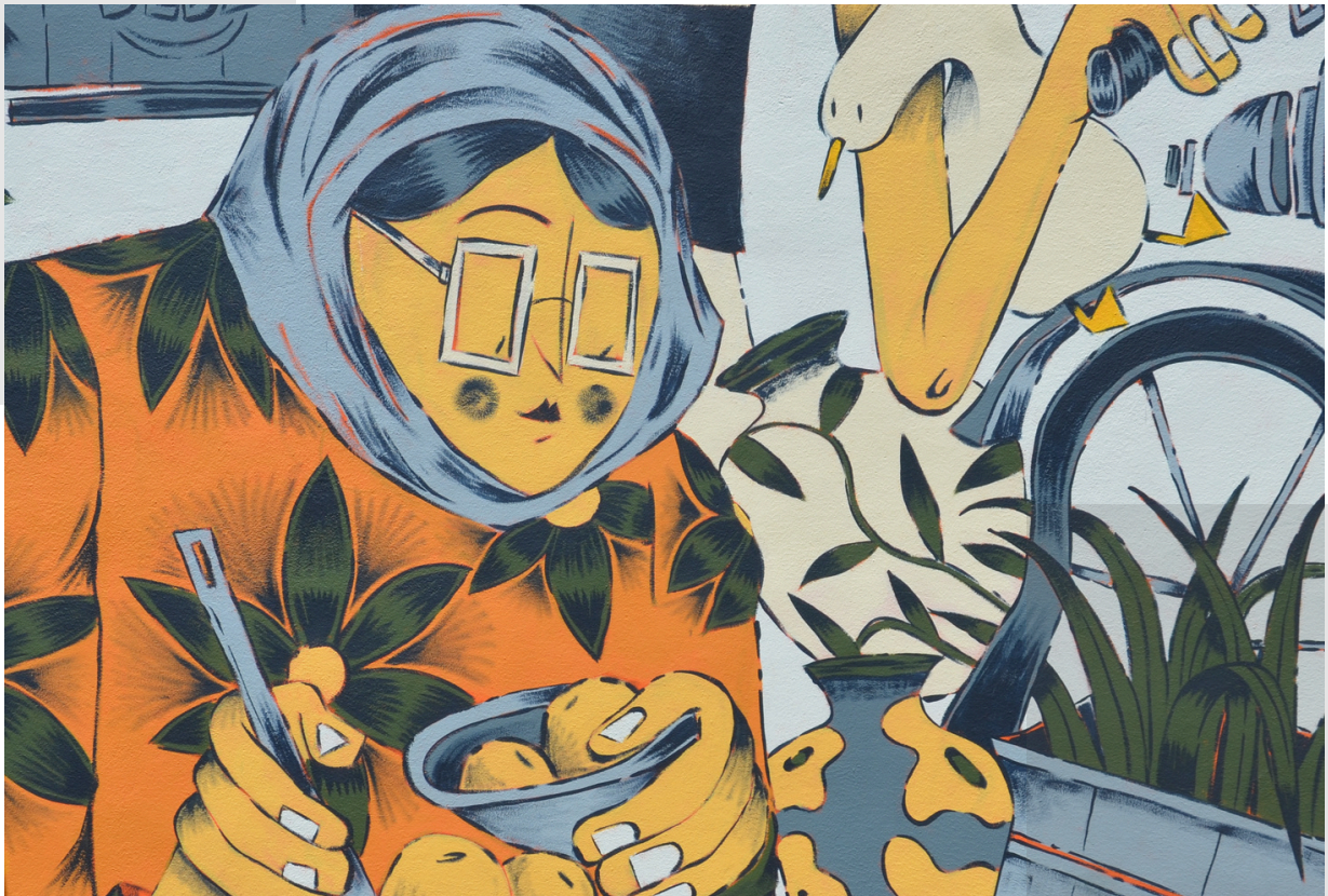
Bouda - LNA2024